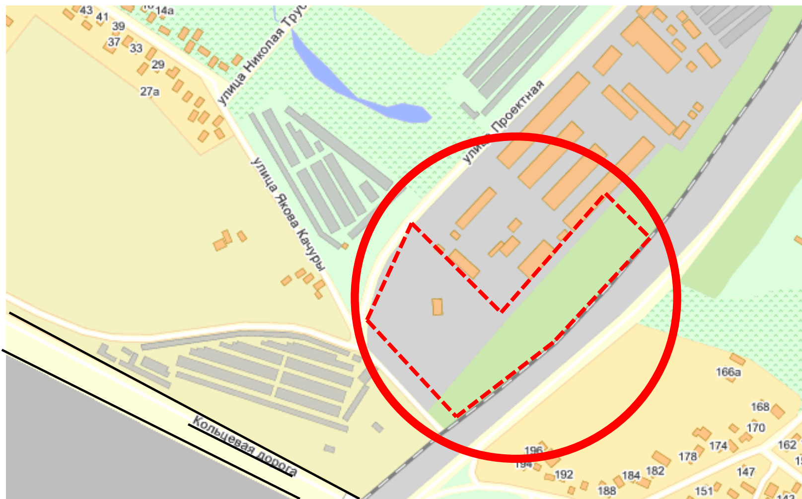
Схема 2. Расположение Объекта в структуре Святошинского района